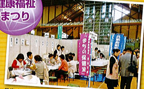
骨密度、血管年齢、ストレス、体年齢等測定ができます。 また、健康づくりの相談や、体験コーナーもあります。