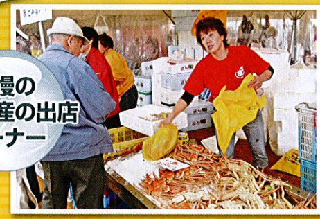
新鮮な農産物や海の幸など自慢の食と特産品、伝統工 芸の展示販売を行います。