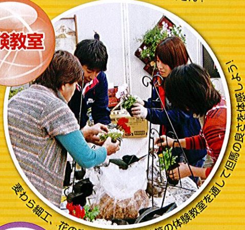
妻むら細工、花の寄せ植え、吊し柿等の体験教室を通して但馬の食を体感しよう!