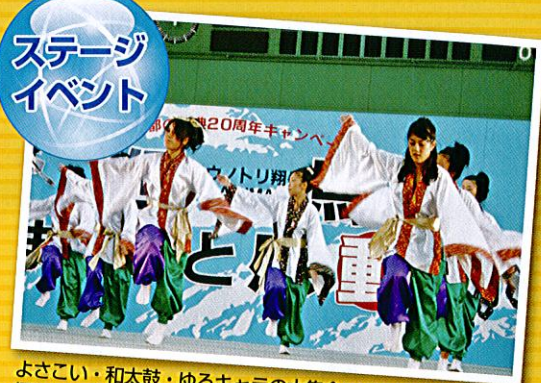
よさこい・和太鼓・ゆるキャラの大集合やオンセンジャーショー、 但馬の紅白歌合戦、コンカツイベント等もりだくさん!