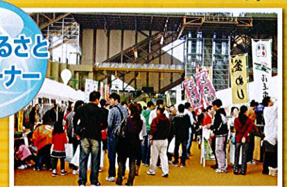
地域の食材を使ったふるさと料理をさらにア レンジ! 豊かな味をご賞味ください。