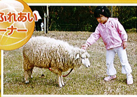
県立但馬牧場公園からウサギやヒツジ達がやって きます。かわいい動物たちとふれあえるよ!