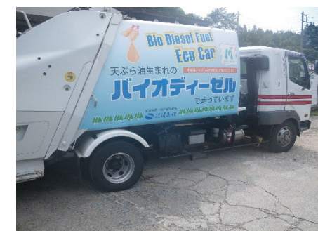
バイオ燃料使用車両