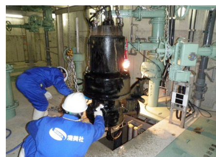
水処理機器の点検