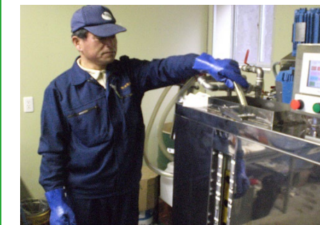
バイオ燃料製造プラント

収集した廃棄物のリサイクルを促進させ、廃棄物の量を削減させます。従来捨てて燃やしていた廃棄物（廃プラ類）のリサイクルや分別することで廃棄物から有価物とし資源の有効活用を図ります。自社バイオ燃料製造プラントの稼働率を上げて自然環境への負荷を軽減します。